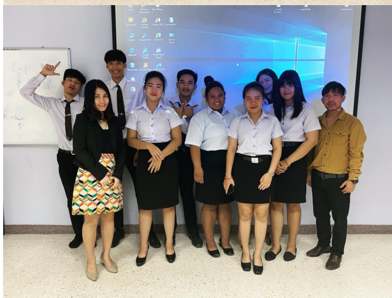
ความเป็นมืออาชีพของนักศึกษาบริหารธุรกิจบัณฑิต สาขาการจัดการ แสดงถึงความพร้อมในการออกปฏิบัติสหกิจศึกษา ความรู้ ประสบการณ์ และบุคลิกภาพ