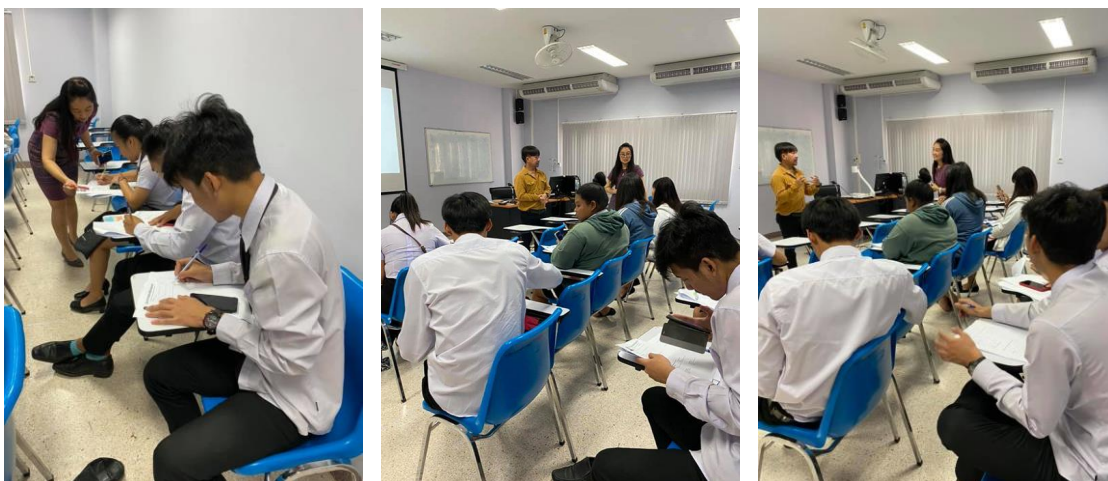
ขณะปฏิบัติการเขียนเรซูเม่ (Work Shop) และแลกเปลี่ยนประสบการณ์ระหว่างอาจารย์ผู้สอนและวิทยาการ