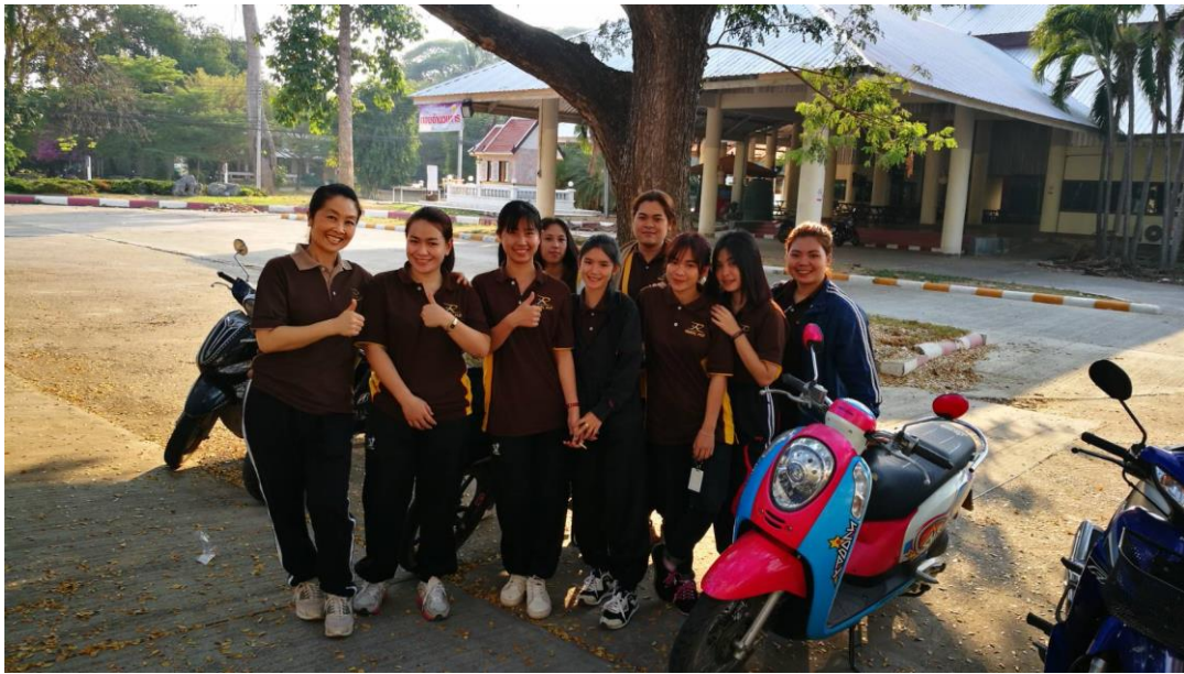
อธิบายวัตถุประสงค์ของกิจกรรมโครงการศิลปวัฒนธรรมสัจจร นักศึกษาประกาศนียบัตรวิชาชีพชั้นสูง ชั้นปีที่ 1 (นักศึกษาที่ปรึกษา)